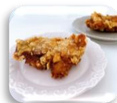
唐揚げ2個 1ポイント