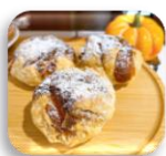
シュークリーム 1ポイント