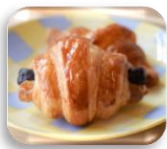
クロワッサン 1ポイント