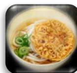
天ぷらうどん 2ポイント