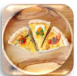
キッシュ 1ポイント