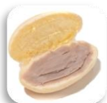
こっぺぱん 1ポイント