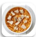
グラタン 3ポイント