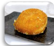
ビーフカレーパン 1ポイント